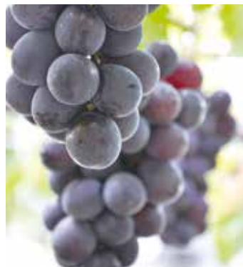
隠れた名品 大粒の甘い甘い巨峰