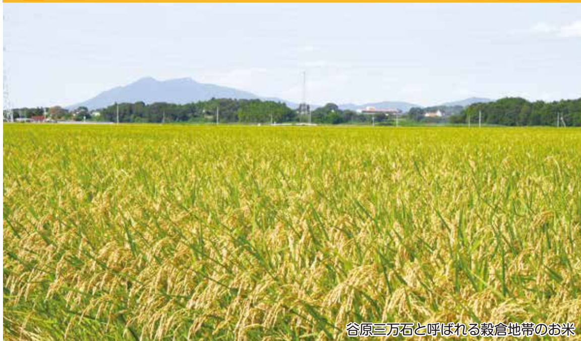
谷原三万石と呼ばれる穀倉地帯のお米