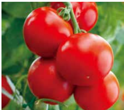
まるでフルーツのような ジューシーなトマト