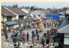
ワープステーション江戸