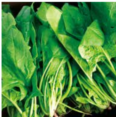
そのままでも食べられる サラダほうれん草