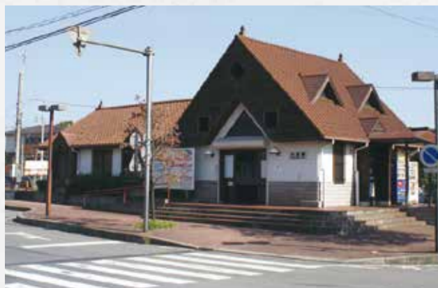
④関東鉄道常総線小絹駅 関東鉄道常総線は、鬼怒川にほぼ並行して走る、全線非電化の珍しい路線です。守谷・水海道駅まで約5分で繋いでいます。