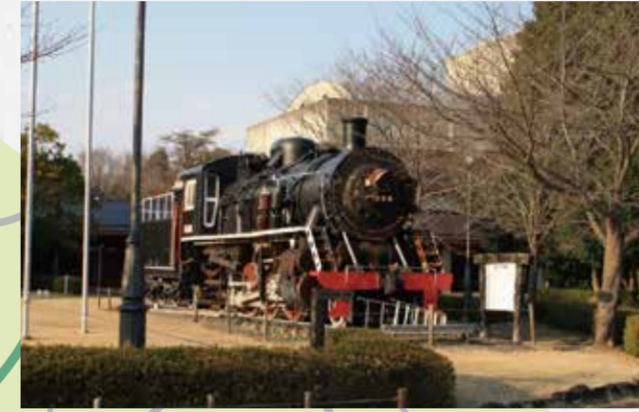
⑩きらくやまふれあいの丘 サウナ室を完備した大浴場やデモスコート、アスレチック広場など子供からお年寄りまで楽しめる総合福祉施設です。 住所■つくばみらい市神生530 Tel.0297-57-0123