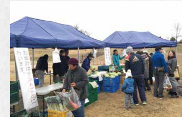
⑧あさのいち 若手農業後継者で構成されるつくばみらい4Hクラブを中心に、毎月第一土曜日にどんぐり公園で新鮮・安心な農産物の直売を行っています。農産物のほかにもさまざまなお店が出店します。 会場■みらい平どんぐり公園(つくばみらい市紫峰ヶ丘4丁目6-6)