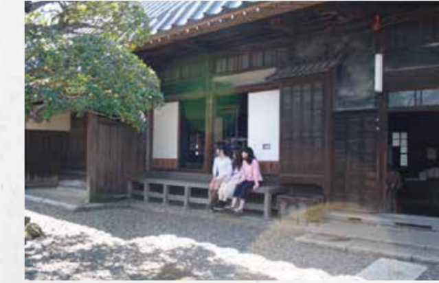
⑪結城三百石記念館 郷土の発展を願って、鎌倉時代初期の朝光公を始祖とする名族である結城家から寄付された屋敷を保存活用し、建物と周辺環境を整備して、市民利用施設として一般公開しています。 住所■つくばみらい市谷井田1647 Tel.0297-58-8822