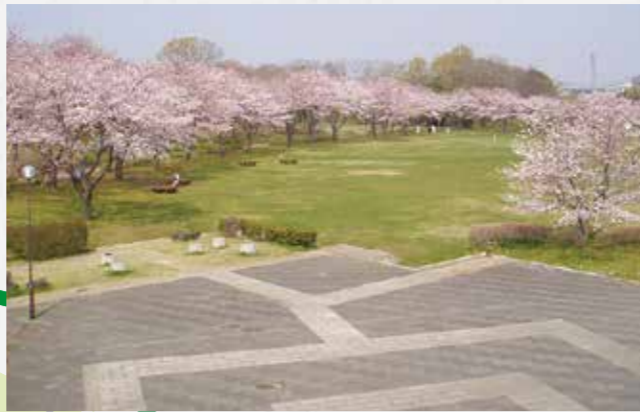
⑤絹の台桜公園 住所■つくばみらい市絹の台3-2 坂野新田