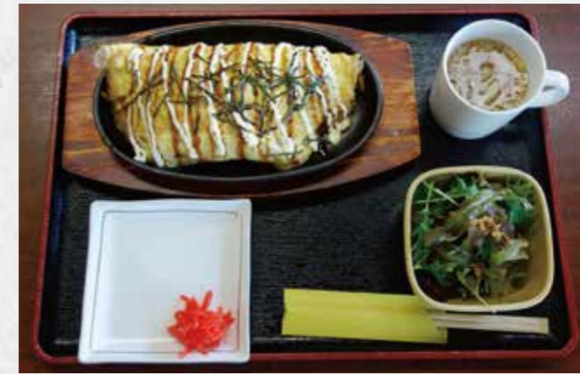
⑦麺工房あおきや(青木製麺工場) 県内の特産品を使用した麺を製造・販売している青木製麺工場が運営するお食事処です。オススメ商品はオムそば。地域のイベントにも積極的に出店し、多くのお客様に好評を得ています。 住所■つくばみらい市板橋2277 Tel.0297-58-2131