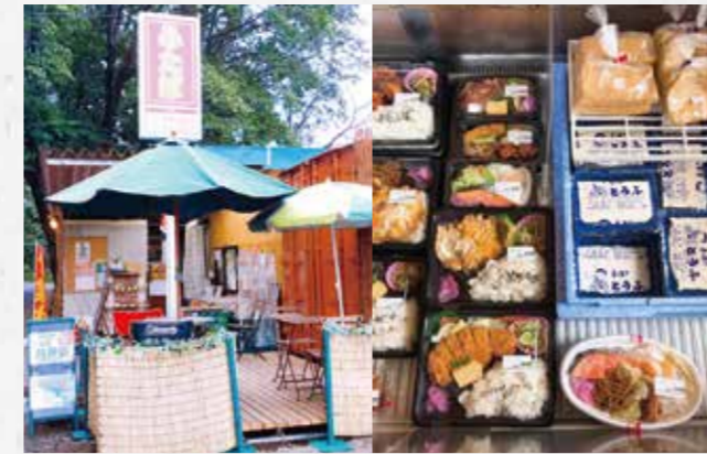
⑥ふたば 地元のお米・野菜に拘ったお弁当屋さんです。店頭では谷和原産のコシヒカリや、地元の生産者さんの新鮮な野菜も販売しています。 住所■つくばみらい市絹戸1749-1 Tel.0297-52-5227