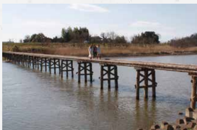
③小目沼橋 昭和31年(1956年)につくられた木製橋で、2度の改修を経て現在に至っています。趣のある風景は映画やドラマの撮影に度々使用され、また釣りスポットとしても知られています。