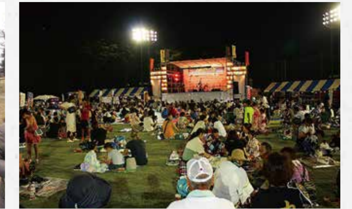
⑨みらいフェスタ 市商工会青年部が主催する夏祭り。お笑いライブやヒーローショーのほか、こども広場や模擬店の出店等、内容盛りだくさんで楽しめます。 会場■市総合運動公園(つくばみらい市小張1770)