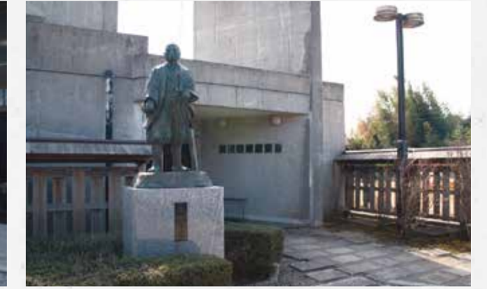
⑫間宮林蔵記念館・生家 この地で生まれ育った江戸時代の大探検家・測量家である「間宮林蔵」ゆかりの資料が豊富に揃っており、敷地内には、生家も移築復元されています。 住所■つくばみらい市上平柳64 Tel.0297-58-7701