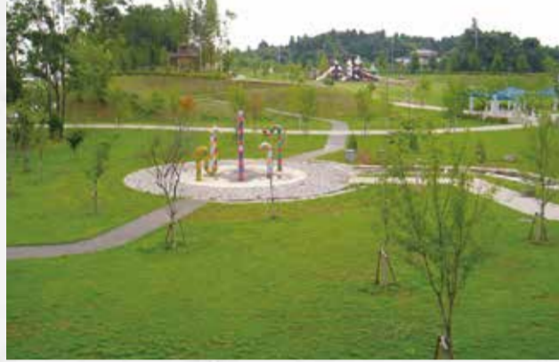
①福岡堰さくら公園 住所■つくばみらい市北山2633-7